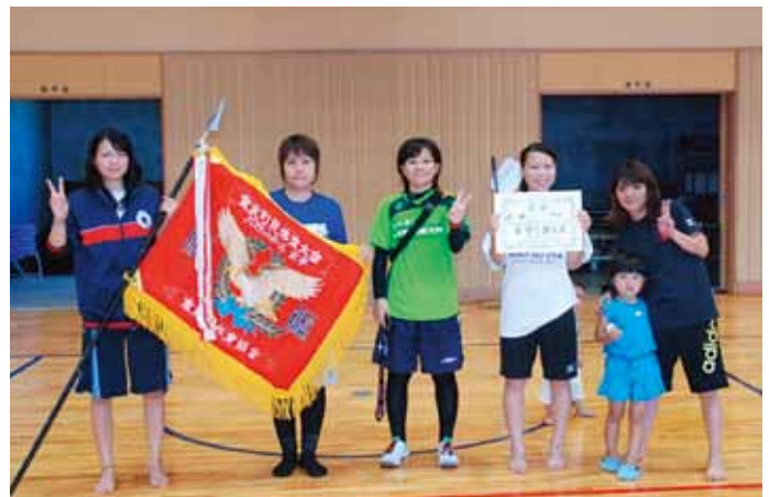
▲バスケットボール競技女子の部優勝の中川区チーム