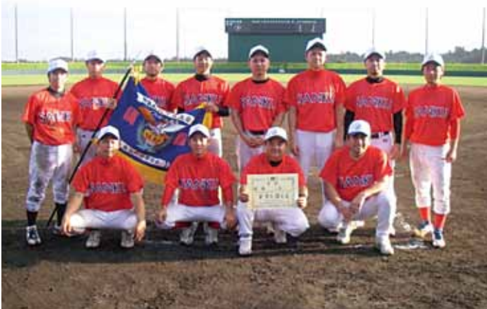
▲ソフトボール競技優勝の三区チーム

今年も第34回金武町町民体育大会が開催されています。6月にスタートしたソフトボールを皮切りに、現在多くの競技が終了しています。各区とも多くの選手が汗を流して大健闘する中今回までに終了した結果を報告します。9月に行われる陸上競技大会までが町民体育大会の期間となりますので町民のみなさまも応援よろしくお願ひいたします。