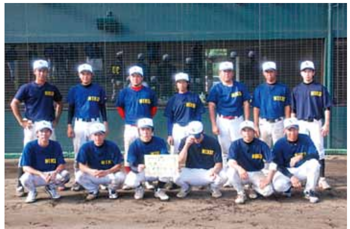
▲軟式野球競技優勝の二区チーム