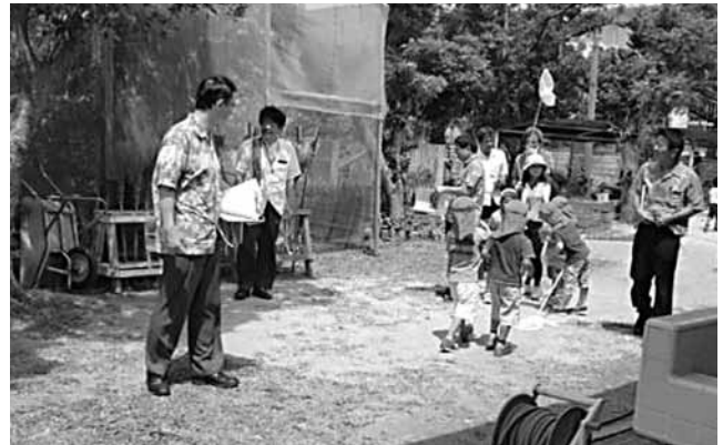
▲幼稚園参観（嘉芸幼）