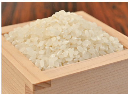
価格が高騰している米

今回重点交付金を利用しての子育て支援米については検討していないため、地元農家との連携等についても具体的な検討はしていない。