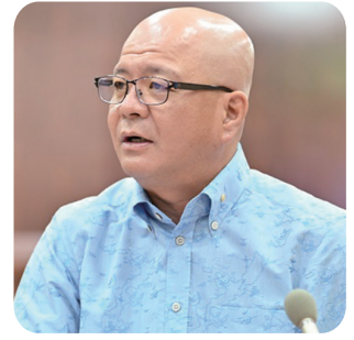
松田 健人 議員