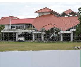
解体工事が決定している 総合保健福祉センター

うことではない。行政の継続性や国や県とのヒアリングの中で事業を承認されたスケジュールの中で進めていかなければならないと考えている。