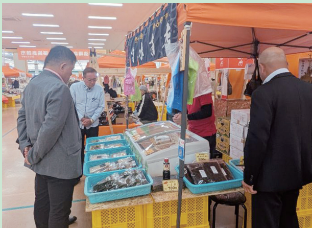
ワイプラス輪島店での出店の視察(石川県)

岐阜県では「スマート農業」の推進により、生産性や収益性の高い産地づくりを目指し、全国初の推進計画として「スマート農業推進計画」を策定している。ロボット技術を活用したスマート農業では自動運転トラクターや収穫ロボット、ドローンなどが導入されており、人手不足解消につながることを期待できる。本町においては、狭小の農地には自動運転トラクターの導入は現実的ではないが、農地の集積・集約の取り組みを行い、広域な農地の確保が実現できれば導入の可能性があるのではないかと考える。また、リモコン式草刈機、アシストスーツ、自動追従運搬車は高齢化する農業従事者の負担軽減につながる効果が期待されることから、これらスマート農業機器の導入について検討していく必要がある。