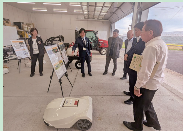
スマート農業機器の視察(岐阜県)