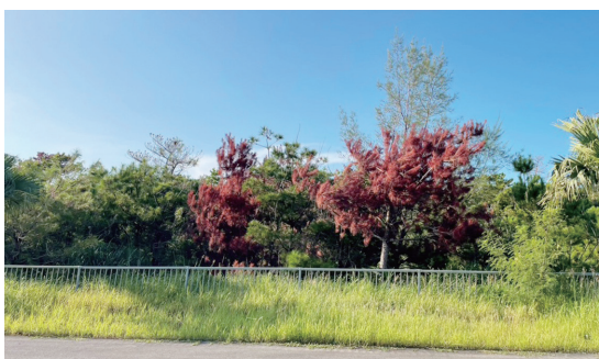
松くい虫被害を受けた松の木

伊藝議員 今後の対応は。 町長 引き続き、被害の早期発見と迅速な駆除を徹底し、松林の保全に努めていく。