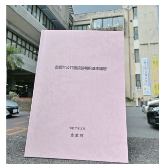
金武町公共施設跡利用構想

画については、北部連携促進特別振興事業等の補助事業と民間活力の活用について調査検討を行い、事業導入に向け、財政負担の軽減を図りながら取り組んでいく。