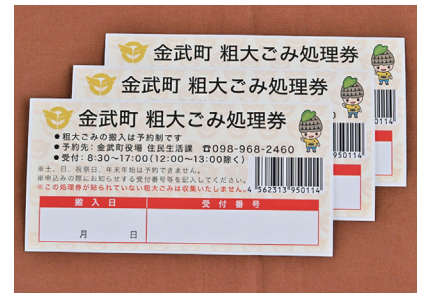
粗大ゴミの処理券

約制により搬入量の平準化とともに粗大ごみの分解・選別等の適正処理により鉄類、アルミ類の再資源化が図られているほか、場内管理についても品目ごとの分別管理が整ってきている。