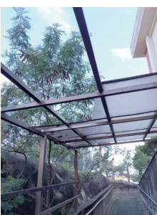
体育館スロープの老朽化した屋根部分

教育長 中央公民館のエレベーター及び渡り廊下の設置で動線が確保されたことにより、既存の体育館西側スロープは現在ほとんど利用がないため、老朽化が著しいスロープの屋根については今後撤去したいと考えている。