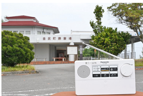
告別式当日、戸別受信機で2回案内

お悔み情報を早期に把握したいという要望や、ご家族の意向等も踏まえながら、早期に放送する仕組みが可能かどうか検討を行っている。