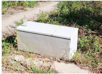
不法投棄されている冷蔵庫

町長 生活環境の保全を図るため、日々の不法投棄パトロール、注意喚起看板の設置に取り組んでいる。また、不法投棄が多発する場所については、監視カメラを設置し不法投棄者の摘発に取り組んでいる。