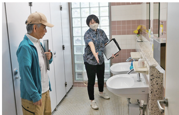
伊芸地区公民館トイレ改修工事