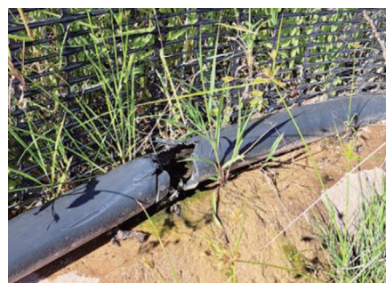
破損して漏水しているパイプ

に町が設置したものである。同パイプは複数箇所が破損しており、漏水が続いている状況があり、早急に漏水を止めるため、パイプ破損箇所の部分的な取替等の対策を実施する。