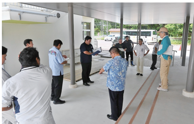
嘉芸小学校屋内運動場建設工事