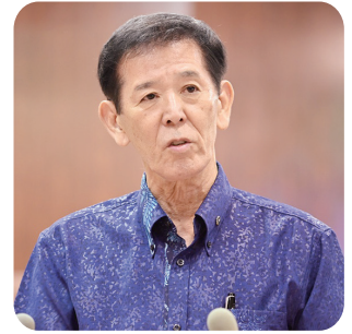
池原 政文 議員