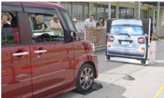
高齢者体験型交通安全教室

総務課長 政府は65歳以上の高齢ドライバーを対象にした安全運転サポートカーの購入支援として1130億円予算計上するというこ