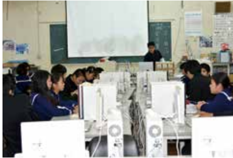
パソコン授業を受ける生徒

教育長 教員の研修を充実させ、国が進める新学習指導要領に沿った教育ができるよう努めたい。