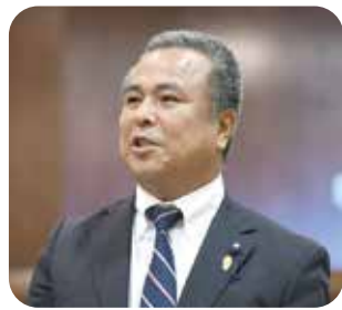
大城 一之 議員