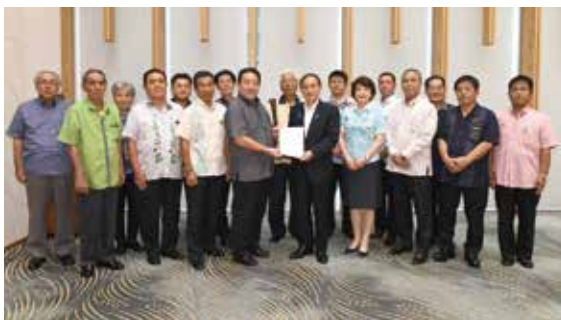
管内閣官房長官への要請 (平成30年7月)

町長 米軍再編の統合計画受入れに伴う管内閣官房長官へ要請した事項の国道329号の渋滞緩和、4車線化については、沖縄総合事務局、北部国道事務所、沖縄防衛局、沖縄県警察本部、西日本高速道路株式会社及び本町で構成する金武