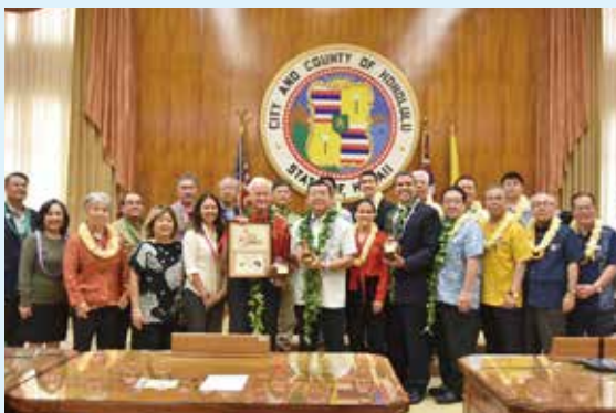
友好都市協定締結式(ホノルル市庁舎)

9日(日)(現地時間8日(土))には、海外移民の父當山久三翁の墓を訪問し、その後ハワイ金武町人会の新年会に参加し、会員らと交流を深めた。