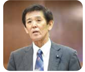
池原 政文 議員