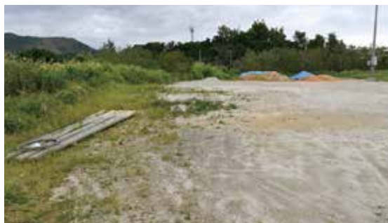
旧嘉芸小学校跡地