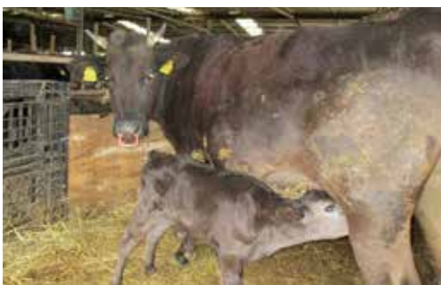
経産牛 (大きいほう)

農林水産課長 まだ具体的な話が出てない。現在は意見集約をもらっている段階である。