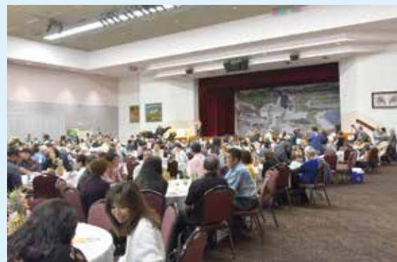
ハワイ金武町人会の新年会(ハワイ沖縄センター)