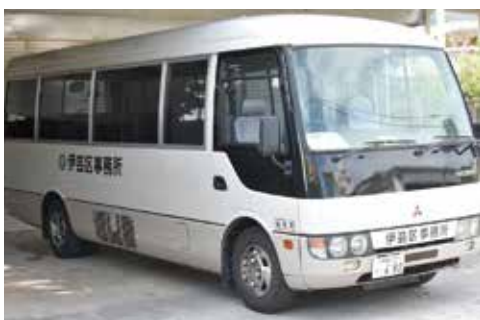
伊芸区のマイクロバス