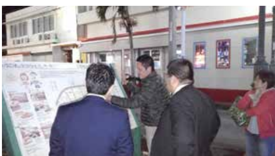
観光協会のナイトツアー

新開地のナイトツアー、町内巡りは観光体験メニューの一つとして定着メニューとして進めているところで、ガイド養成を含めた町の歴史や文化概要の勉強会も行っている。