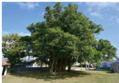
町指定文化財のがじまる

状況も承知している。所有者である伊芸区と相談し、樹木を守りながら区民が活用できる場所という2つの課題を解決しながら対応していきたい。