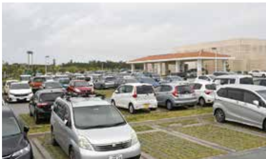
スポーツ大会時は医療施設の駐車場を活用している

教育長 多目的屋内運動場の計画があり、施設を整備する際に周辺に一定の駐車場を確保することで計画をしている。