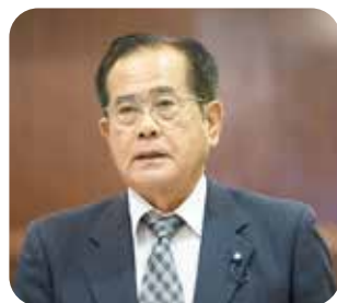
安富 信武 議員