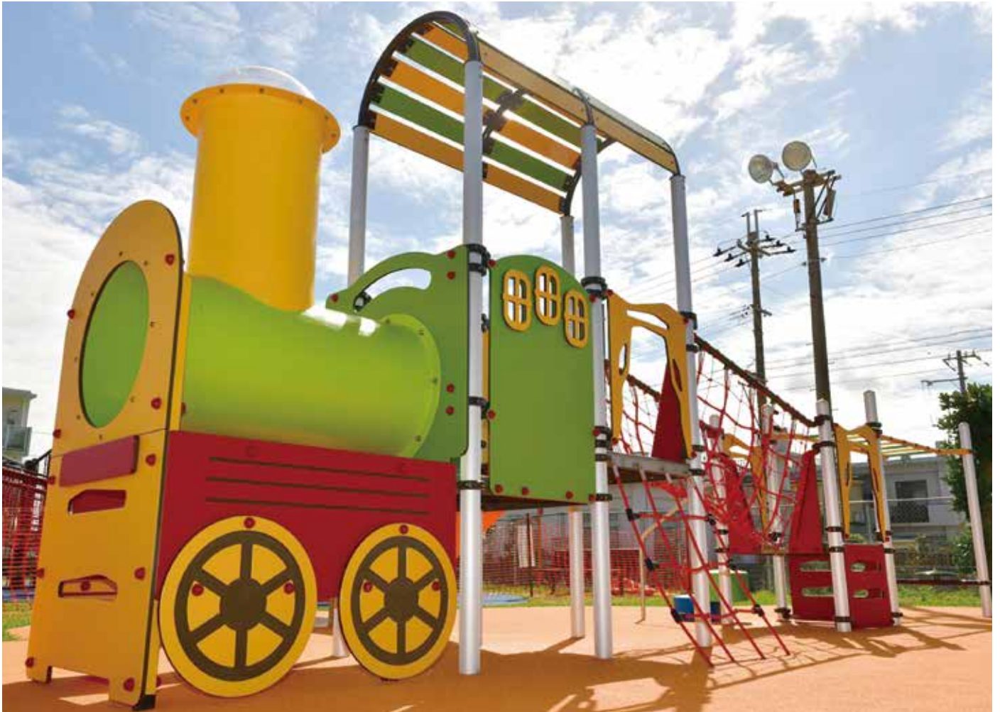
新装になった屋嘉児童公園（仮称）。遊び場のシンボル汽車型ザイルクライミング遊具