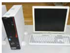
授業で使うパソコン

コンピュターの1台当たりの児童生徒数は全国平均5.4人に1台、沖縄県平均4.8人に1台に対して町は平