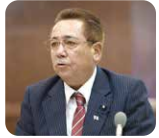
仲間 トム 議員