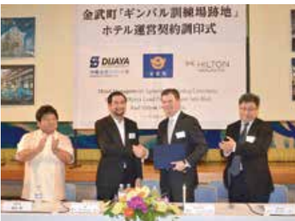
平成28年のホテルオープンを発表(平成25年7月30日)