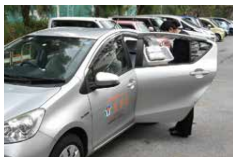
配食する弁当を車に載せる