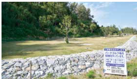
工事が進むパークゴルフ場

と締結した金武町パークゴルフ場整備及び管理運営に関する覚書により、施設整備を町で行い、施設の管理及び運営を同区で行うことを合意して進めている。