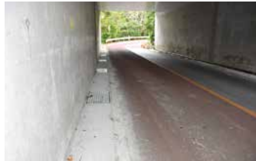
改修されたボックスカルバートの側溝