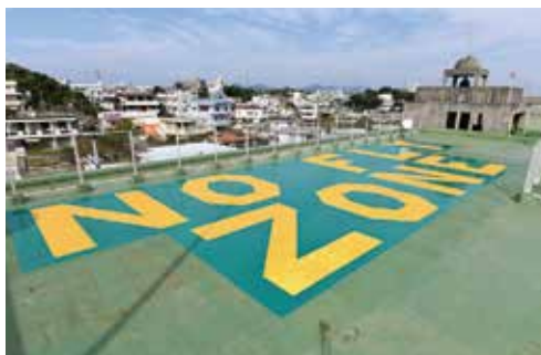
金武小屋上のヘリサイン塗装