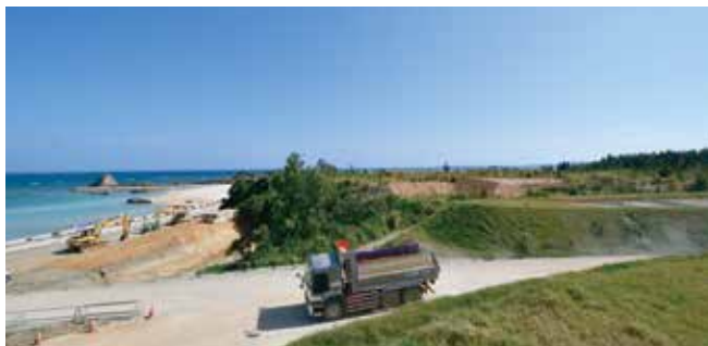
整備が進む海岸(左)と建設が遅れているホテル予定地(右)