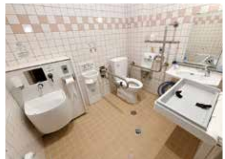
陸上競技場の多目的トイレ

また、既存の施設はバリアフリー新法に基づき改修を行い、身障者用トイレに合わせ、オストメイトを役場庁舎、町立中央公民館、町立図書館等に設置している。