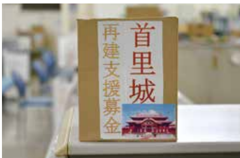
役場内に設置されている募金箱

総務課長 12月号の広報金武、ホームページ、SNS、LINEで募金の呼びかけをしている。