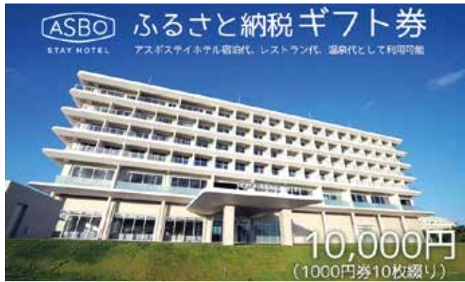
▲ふるさと応援寄附金の返礼品

寄附額で2億円を超えて、堅調に推移しており今後も魅力的な特産品や体験プログラム等の返礼品を提供し、自主財源の確保に努めてまいります。