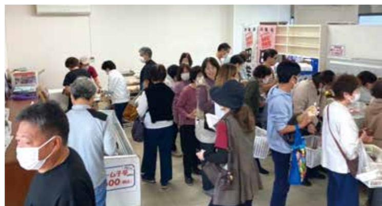
▲金武町アンテナショップ調査実証試験（農産物即売会）

田芋については、技術指導・病害虫駆除対策講習会等を通して品質向上を図りつつ、イベント等を活用したPR活動に取り組んでまいります。