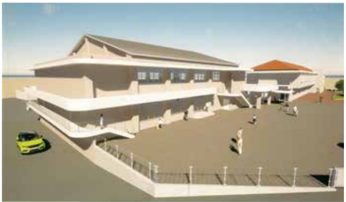
▲嘉芸小学校屋内運動場イメージ図

学校給食については、増加する食物アレルギーへの対応と労働環境の改善を図るため、給食センター施設整備計画に基づき、設備や調理機器の更新等を行い、安全・安心な給食の提供に努めてまいります。