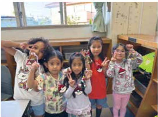
▲金武町放課後子ども教室事業

現できるような学習環境の充実を図ってまいります。また、町内すべての児童に各種体験や異世代交流の機会を提供する「金武町放課後子ども教室事業」の充実化を図り、子どもたちの非認知能力の向上、地域が一体となり子どもたちを守り育てる環境づくりを推進してまいります。