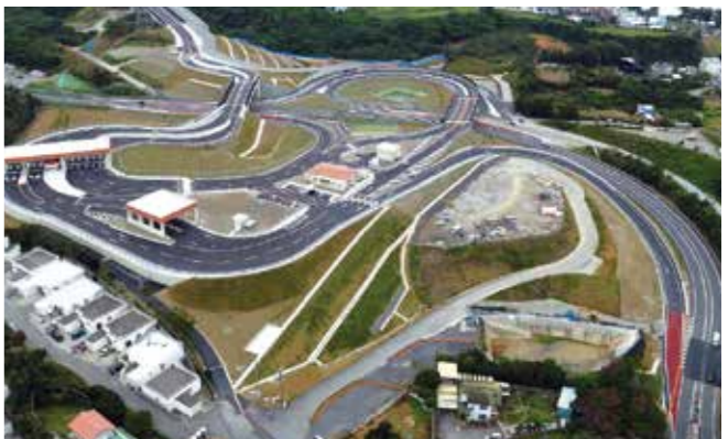
▲キャンプ・ハンセンへのアクセス道路・新メインゲート(第1ゲート)

再編関連工事の町内業者優先活用については、地元企業が多く活用される事で、雇用拡大、就業者の消費需要、関連産業の活用等、地域経済の活性化に大きく寄与されるものであり、優先発注を推進し更なる受注機会の促進に努めてまいります。