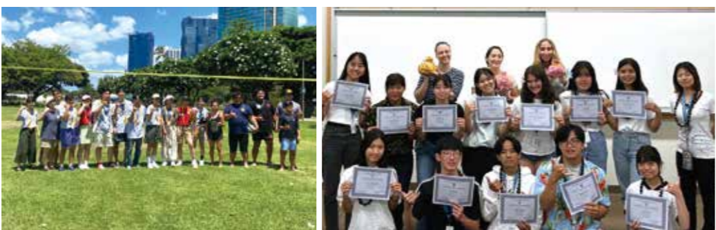
▲ハワイ短期留学派遣事業

幼児教育の振興については、令和5年度に設置した金武町幼児教育センターを拠点に、町・こども園・小中学校等が連携