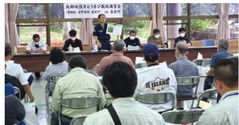
▲北部地区さとうきび栽培講習会 in 金武町

農業の振興については、継続的な栽培技術指導等を図り、安定的な生産向上及び担い手の育成に努めてまいります。生産農家には、農業経営の安定維持を図るための「肥料・農薬購入補助金」や生産向上を図るための「生産機具及び施設資材購入補助金」等の支援を行ってまいります。また、近年頻繁に出没