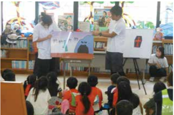
▲読書フェスティバル

生活スタイルに応じた読書活動推進のため金武町電子図書館の利用促進、サービスの充実化に取り組んでまいります。