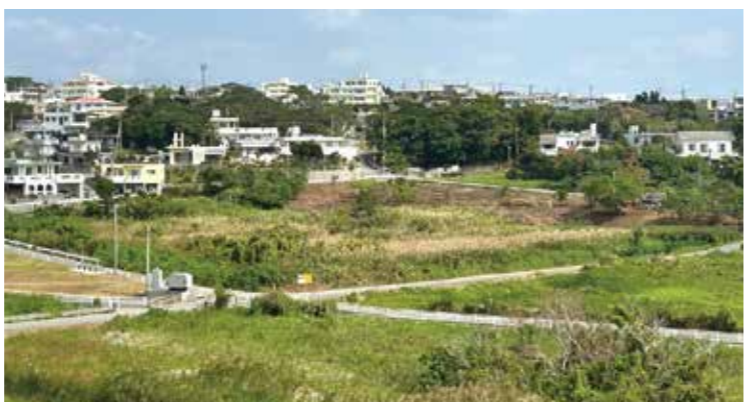
▲並里区武田原地区

高齢者の交通事故防止対策については、65歳以上の高齢者ドライバーが保有する車両へのペダル踏み間違い急発進等抑制装置の設置費用補助事業を引き続き実施し、運転者と歩行者の双方にとって安全・安心な交通環境の整備を推進してまいります。