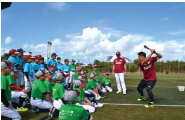
▲楽天イーグルス野球教室

OP日本代表チームが令和6年3月に金武町ベースボールスタジアムで強化合宿を実施致します。今後も、プロスポーツキャンプ受け入れ時の各種教室等を通じて本町の子どもたちがプロスポーツに触れ親しむ機会を提供し、夢や希望を持てる環境づくりを推進してまいります。