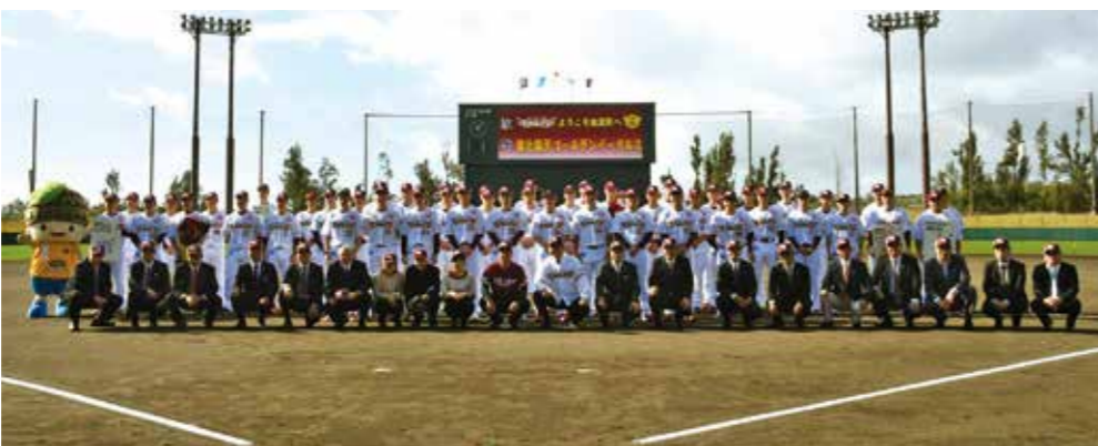
▲東北楽天ゴールデンイーグルス 歓迎セレモニー

雇用対策については、金武町就活支援センターを拠点に求職・求人情報等を一元化し、就職斡旋、合同企業説明会の開催、資格取得のための講座開設など、若者と町民の雇用拡大と人