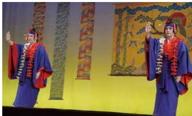
▲金武町民俗芸能祭 屋嘉区「恩納節」

能の魅力を再認識する機会を提供するとともに民俗芸能の保存継承支援に努めてまいります。