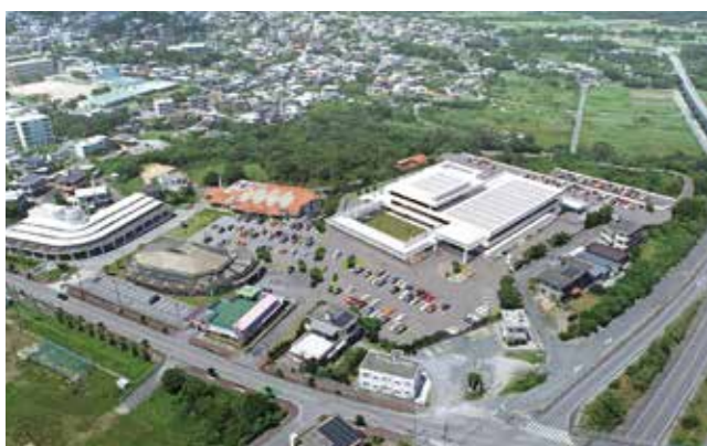
▲金武町複合庁舎（イメージ）

た内容の詳細をまとめてまいります。今後も引き続き、50年先、100年先を見据え、町民とともに創るまちづくりの象徴として、複合庁舎整備事業を進めてまいります。 現庁舎の跡利用については、平成初期策定の金武町ミュージアム基本構想、平成13年度策定の金武町移民資料館等に関連する基本構想を実現するため、現庁舎をリフォームし、移民・民俗資料館として再整備に向けて取り組んでまいります。