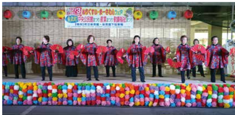
▲中央公民館まつり

の提供機会の充実を図り、地域や町民とともに薫り高い教育文化のまちづくりを推進してまいります。