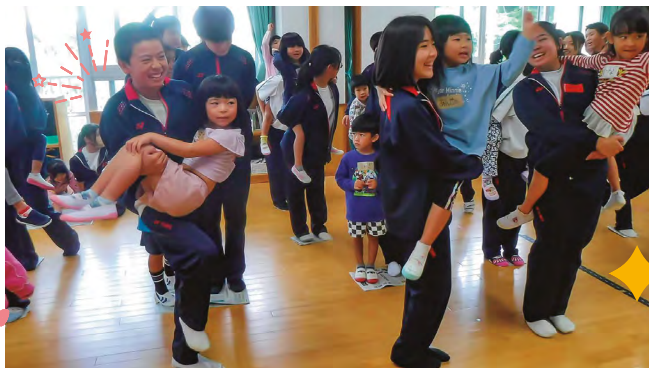
▲園児と中学生が交流している様子

金武町幼児教育センターの事業や取り組みを分かりやすく発信し、更なる理解や協力が得られることを目的に掲載します。