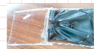
▲車内の熱で変形したCDケース