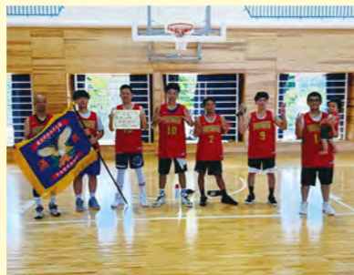
▲バスケットボール男子 優勝の二区