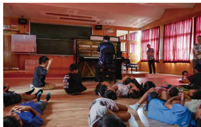
▲部屋を暗くし、寝そべりリラックスして演奏を聴く児童たち