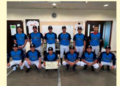
▲軟式野球準優勝の四区