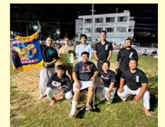
▲沖縄角力優勝の 屋嘉区