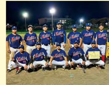
▲ソフトボール優勝の一区