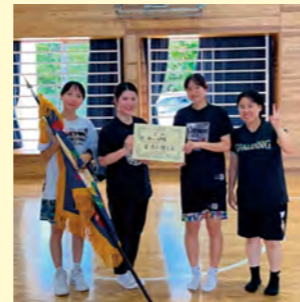
▲バスケットボール女子 優勝の四区