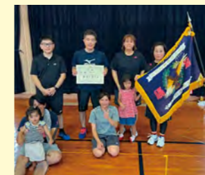
▲バドミントン優勝の 三区