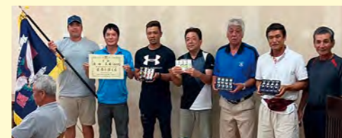
ゴルフ 優勝の三区