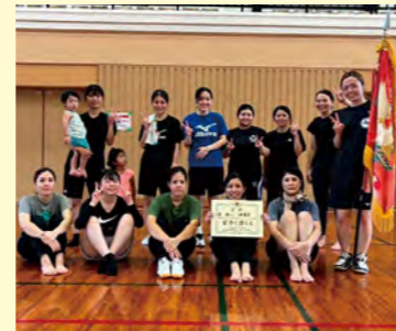
▲バレーボール女子 優勝の伊芸区