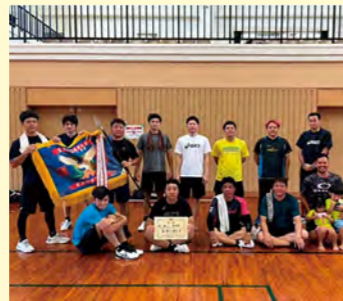
▲バレーボール男子 優勝の中川区