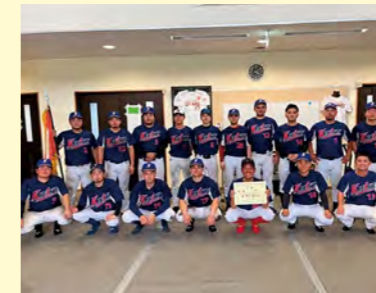
▲軟式野球優勝の一区