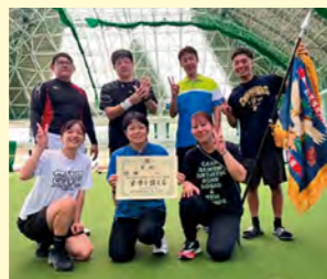
▲ソフトテニス優勝の 四区