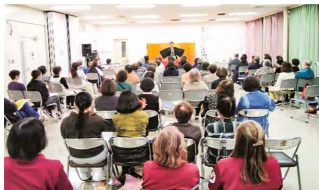
▲落語で笑って終活講演会の様子