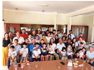
▲ボリビア町人会の方々と交流

ボリビアは、土地の広さも、空の感じも、「同じ地球なのにこんなに違うのか」と驚かされました。ロボレ周辺で行った温泉は観光として整っており、ホテルのプールが温泉、さらに川そのものも温泉になっている場所でした。自然の中に温かい水が流れていて、人工的な施設とは違う「土地の力」を感じました。金武町の自然体験でも、作り込みすぎない魅力の出し方があるのではないかと考えるきっかけになりました。