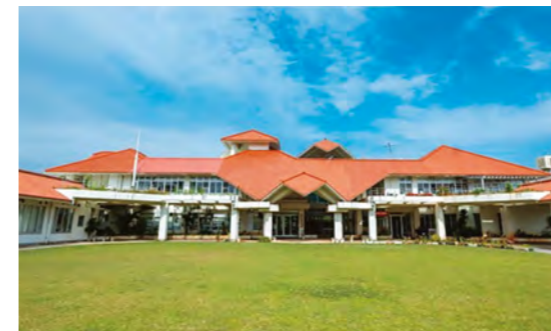
【金武町総合保健福祉センター】

金武町総合保健福祉センターの取り壊しに伴い、 災害時(台風等)の避難所が変更となります。