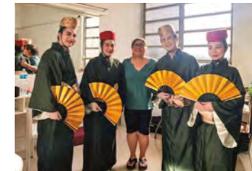
▲新年会でかぎやで風を披露