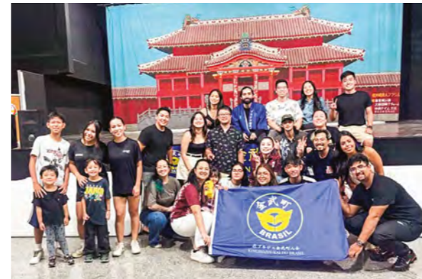
▲ブラジルで町人会の新年会に参加