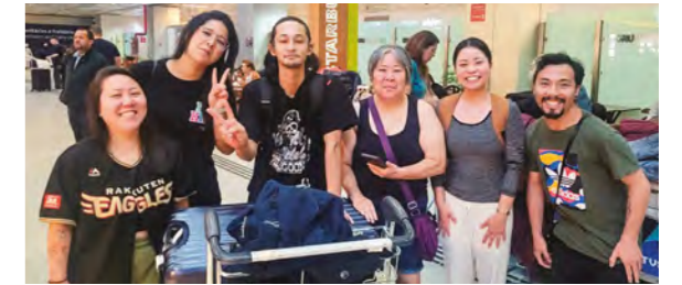
▲空港での出迎えの様子