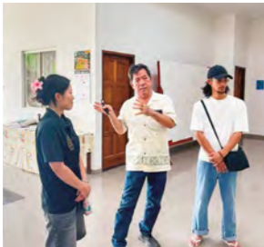
▲オキナワボリビア歴史資料館

ボリビアでは、日本語やうちなーぐちが日常的に使われ、若い世代も日本語を流暢に話していることに大変驚かされました。私たちがうちなーぐちをほとんど話せないと知ると、初日から温かくレッスンをしてくださり、交流の深まりを感じました。前半はコロニア・オキナワ、後半はサンタクルスで過ごし、農場や畜産、CAICOの pasta 工場を訪問しました。移民当初の苦勞と受け継がれてきた思いを学び、2世・3世が営む日本料理店では文化が継承されていることを実感しました。さらに Roboré や Torre de Chochís を訪れ、雄大な自然にも触れる貴重な経験となりました。～金城千寿～