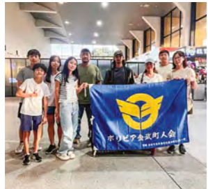
▲空港での出迎えの様子