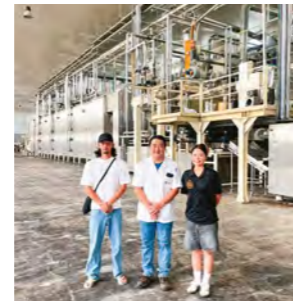
▲CAICOの パスタ工場視察

ボリビアでは、日本語やうちなーぐちが日常的に使われ、若い世代も日本語を流暢に話していることに大変驚かされました。私たちがうちなーぐちをほとんど話せないと知ると、初日から温かくレッスンをしてくださり、交流の深まりを感じました。前半はコロニア・オキナワ、後半はサンタクルスで過ごし、農場や畜産、CAICOの pasta 工場を訪問しました。移民当初の苦勞と受け継がれてきた思いを学び、2世・3世が営む日本料理店では文化が継承されていることを実感しました。さらに Roboré や Torre de Chochís を訪れ、雄大な自然にも触れる貴重な経験となりました。～金城千寿～