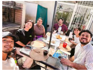
▲アルゼンチン町人会の方々と交流