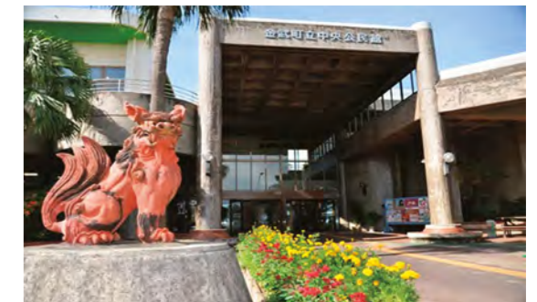
【金武町立中央公民館】

◎ 町民の皆さまへ、台風時等の避難所としてご利用いただいていた、金武町総合保健福祉センターの取り壊しに伴い、 金武町立中央公民館 が台風時等の避難所となります。