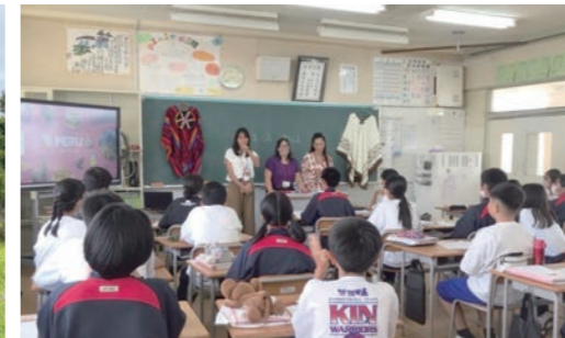
金武中学校 各国の紹介をしました!