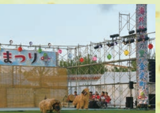
並里区伝統芸能保存会 (親子獅子)