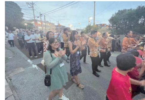
観月祭 ノロ殿内への獅子奉納や、ガーイーに参加しました。