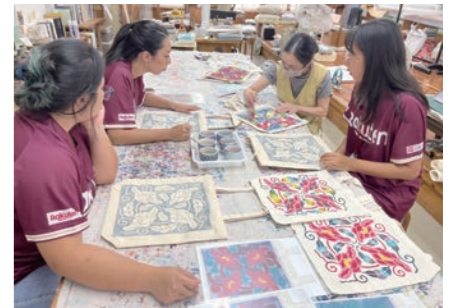
紅型研修 紅型のトートバッグを作成♪