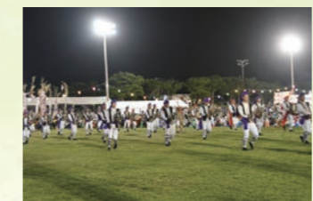
エイサー (金武区青年会・伊芸区青年会)