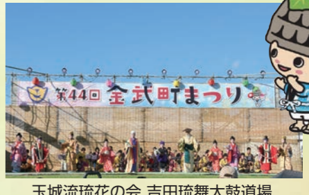
玉城流琉花の会 吉田琉舞太鼓道場 名護みのり箏三線研究所による幕開け