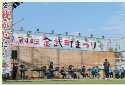
金武中学校 吹奏楽演奏