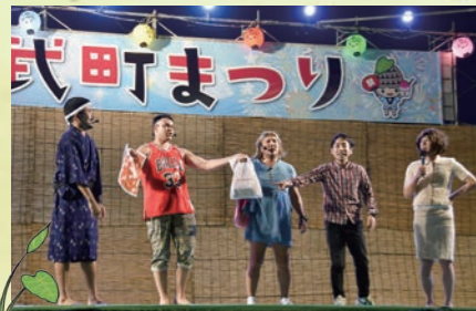
ありんくりん・初恋クロマニヨン