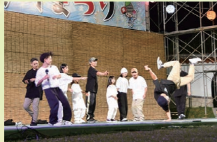
ONE PIECE (ブレイクダンス)