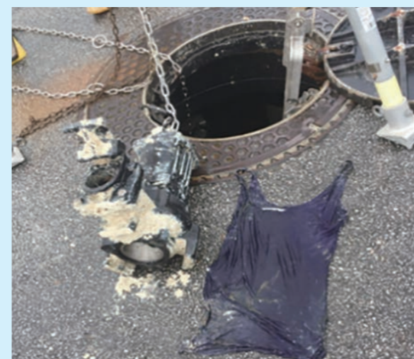
※つまりの原因となった衣類や大量の油

また、宅地内の排水管は個人管理となりますので、定期的な清掃を行いますようお願いいたします。