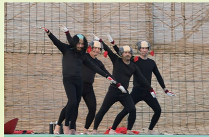
現代版余興 宴座家 (やんざやー)