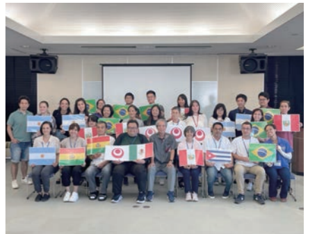
JICA 日系社会研修 沖縄や移民の歴史等について学びました。