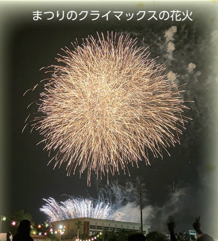
まつりのクライマックスの花火