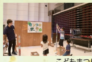
子どもまつり (巨大迷路)