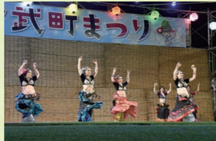
チャンドリカ (トライバルベリーダンス)