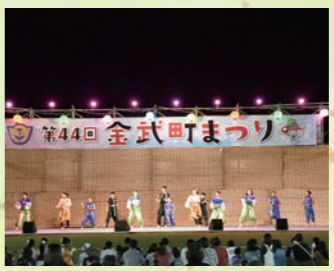
当山久三ロマン演劇団