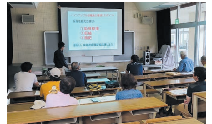
▲パイン栽培講習会の様子

金武町産のパインは、ふるさと応援寄附返礼品として平成29年度から令和4年度にかけて年々注文数が増えている人気の返礼品として、今年も全国の方々が金武町産のパインの出荷を楽しみにしています。